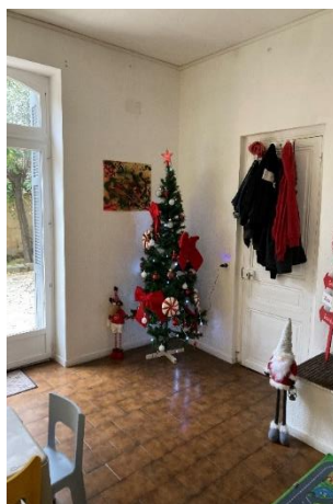
Le coin des petits dans une des salles de jeux et décorations de Noël fait par les enfants