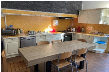
La cuisine pour les repas avec les éducateurs et les ateliers parents-enfants